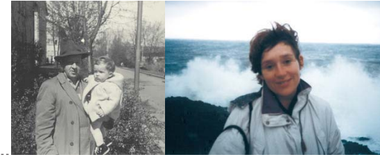
Sicherheit und Unsicherheit – Vordergründiges und Hintergründiges

Um aber die Wünsche an neue Bilder zu umschreiben, kommt die sorgfältige Lektüre erst an zweiter Stelle. Die fotografierte Person entscheidet schnell, ob sie die Mühsal dieser Lektüre auf sich nehmen will. Sie sieht sofort, ob die Zusammenstellung etwas trifft – ob sie überrascht und befremdet, einleuchtet und gefällt, verrätselt oder langweilt. Für sie ist augenfällig, ob zwischen Bildern ihrer Person etwas geschieht, ob die Varianten der Motive reizvoll sind, die Komposition und die Farben kontrastieren oder Bögen schlagen. In der ästhetischen Wahrnehmung wird vorentschieden, ob die Lektüre lustvoll in Angriff genommen wird. MG