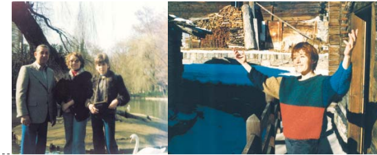
Verschlossen und offen