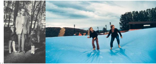
Sicherheit und Unsicherheit – Stabilität und Labilität